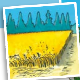
Les champs de céréales