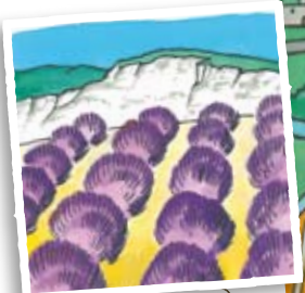
Les champs de lavande